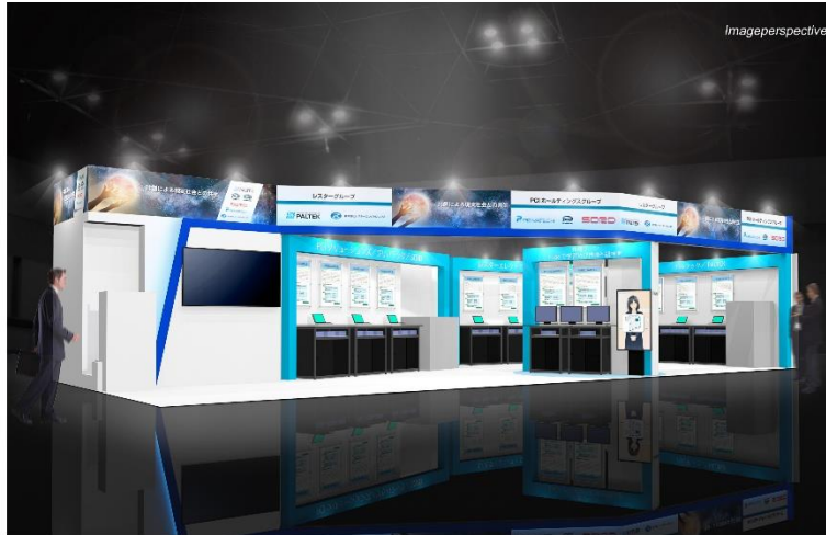
出展ブースイメージ

また、「～共創による現実社会との共生～」をテーマに、共同出展する企業とともに共創ブースを用意しています。